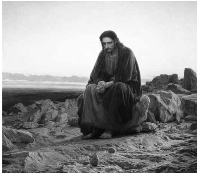
Художник Иван Крамской

Пост существовал еще в Ветхом Завете. Так, 40 дней постились пророки Моисей и Илия. Господь наш Иисус Христос перед выходом на общественное служение постился 40 дней в пустыне. Среди постов, установленных Церковью, главным и древнейшим является Великий пост, который также